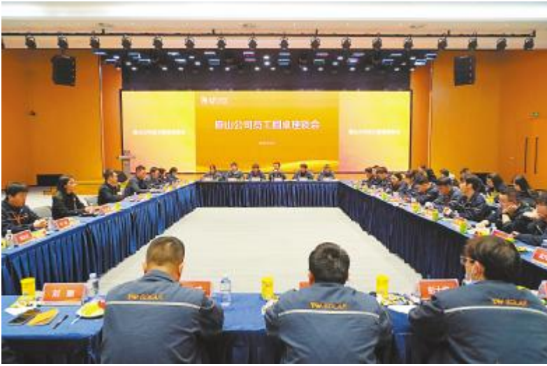
员工圆桌座谈会现场