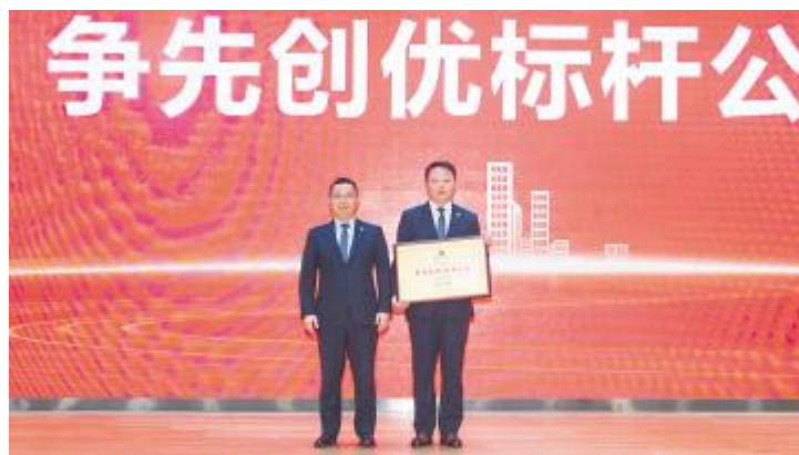
“争先创优标杆公司”颁奖现场

大会首先通过一段视频短片对通威太阳能 2024 年奋斗征程进行回顾,对优秀员工、优秀团队的先进事迹及奋进精神进行赞扬与表彰。此次表彰颁发“十年忠诚员工”“岗位标兵”“岗位能手”“岗位之星”“安全标兵”“宣传之星”“未来之星”“优秀管理者”8 大个人奖项及“年度最佳五型班组”“企业文化践行模范部门”“安全生产先进部门”“最佳业务支持部门”“人才培养共享部门”“最佳成本贡献部门”“质量品牌标杆公司”“争先创优标杆公司”8 大优秀团队奖项。通威太阳能各公司共有 313 名个人、36 个团队获以上殊荣。此次大会还特别设置了优秀经验案例分享环节,各公司优秀代表结合工作实际,生动讲述了如何面对挑战、创新求变、取得佳绩的案例。这些案例不仅彰显了优秀个人、标杆团队的智慧与勇气,更为广大员工提供了学习机会与宝贵经验,进一步营造了“比学赶帮超”的氛围,激发了大家的奋斗及创新热情。