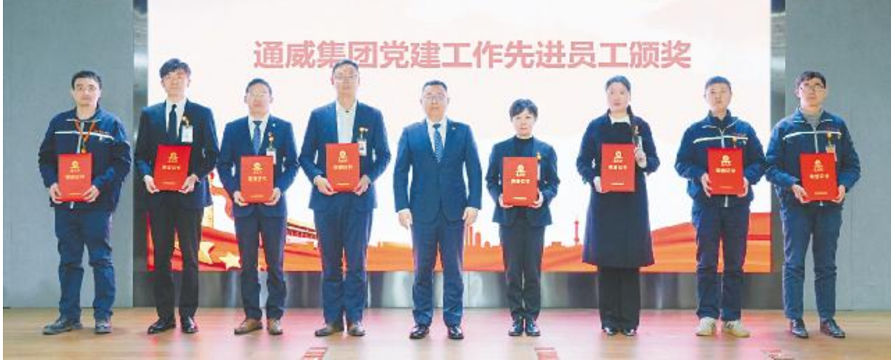
“通威集团党建工作先进员工”表彰现场