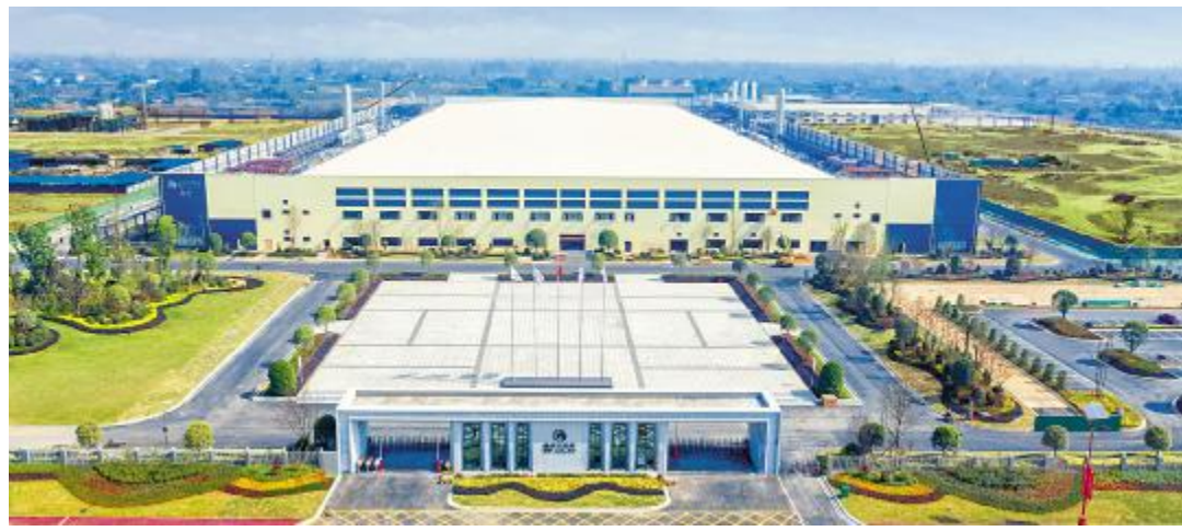
通威太阳能绿色工厂