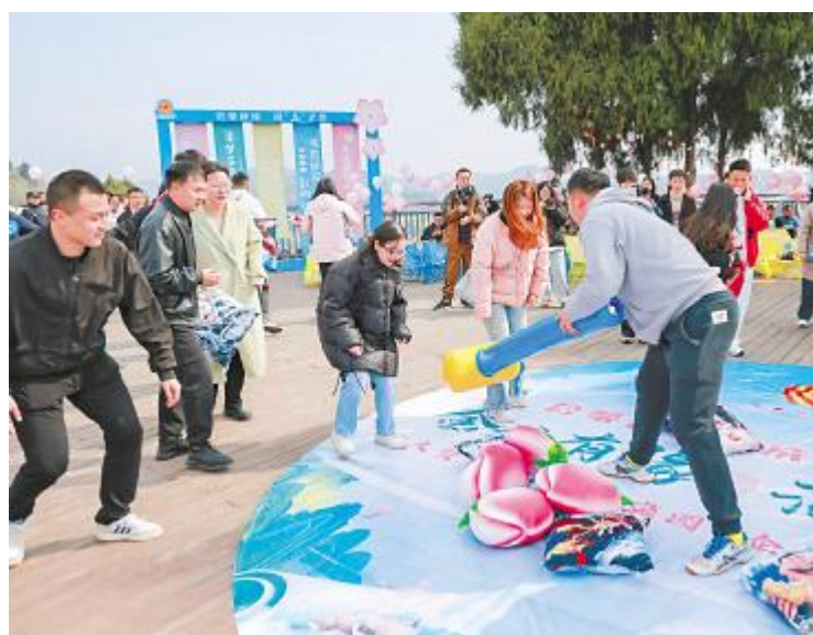
“金生有缘 浪漫登堂”交友活动现场