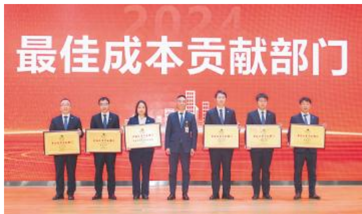
“最佳成本贡献部门”颁奖现场