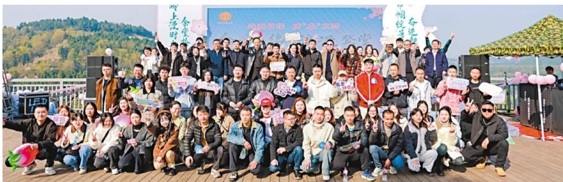
交友活动合影留念

2月26日,为丰富员工精神文化生活,增强团队凝聚力,通合新能源金堂公司党支部与通威太阳能金堂公司党支部联合开展了“传承中华精神 坚定理想信念”主题观影活动。60余名党员、团员和员工代表共同观看电影《哪吒之魔童闹海》。观影过程中,员工们沉浸在影片紧张刺激的情节之中,不少员工已经是第二次观看这部电影,但依旧被影片的魅力所征服。未来,通合公司党支部、金堂公司党支部将继续加强联动,策划更多丰富多彩的活动,助力员工在工作与生活中找到更好的平衡,共同推动公司持续发展。