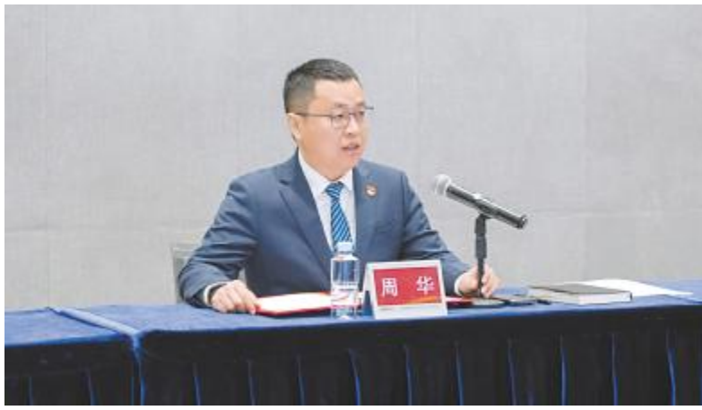
通威太阳能成都公司党委成功召开2025年第一季度党员大会暨组织生活会,周华书记总结发言

此次签订仪式不仅是对通威太阳能安全环保工作的全面规划与部署,更是通威太阳能坚定践行社会责任的庄严承诺。未来,通威太阳能将继续秉承“安全第一、环保先行”的核心理念,推动公司在全球舞台上稳健前行,实现更高质量的发展。