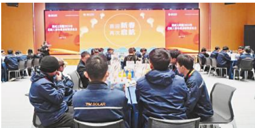
通威太阳能 2024 届启航生喜乐会活动现场