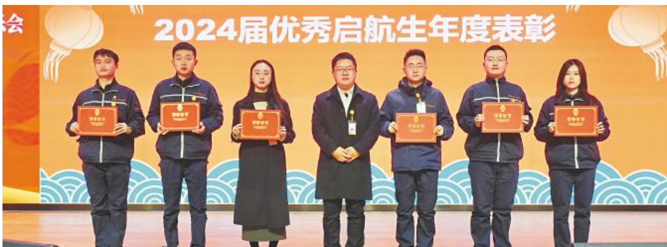
年度优秀启航生表彰现场

圆梦启航,共赴 2025 新征程。通威太阳能启航工程项目将持续为公司注入新的活力,丰富公司高潜人才储备池。展望未来,人力资源部将继续密切关注每一位启航生的成长动态,不断优化和完善培养方案,为公司的持续发展提供有力的人才支撑,助力公司穿越周期,迎接更加美好的明天。