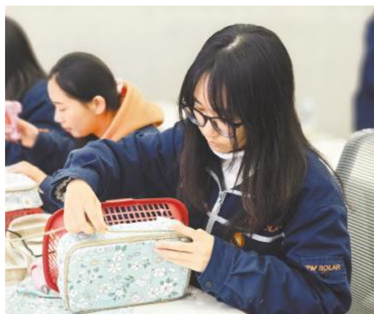
眉山公司手工社团活动