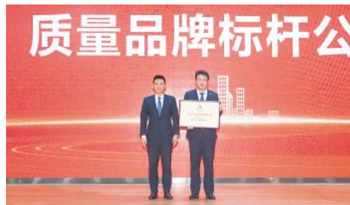
“质量品牌标杆公司”颁奖现场