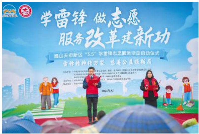
通威太阳能眉山公司受邀参加眉山天府新区“3·5”学雷锋志愿服务活动

阳春三月,通威太阳能持续开展别开生面的研学参观活动;积极组织并开展主题观影、乒乓球友谊赛等活动;加强政企联系,积极参与学雷锋志愿服务启动仪式、企业专场交友等活动,以此进一步面向大众进行光伏知识的科普;增强团队凝聚力,提升员工归属感,同时传播正能量,营造和谐健康、积极向上的工作氛围。丰富的活动展现了通威太阳能作为行业领军者的社会责任感与人文关怀,为公司的可持续发展注入了强劲动力。