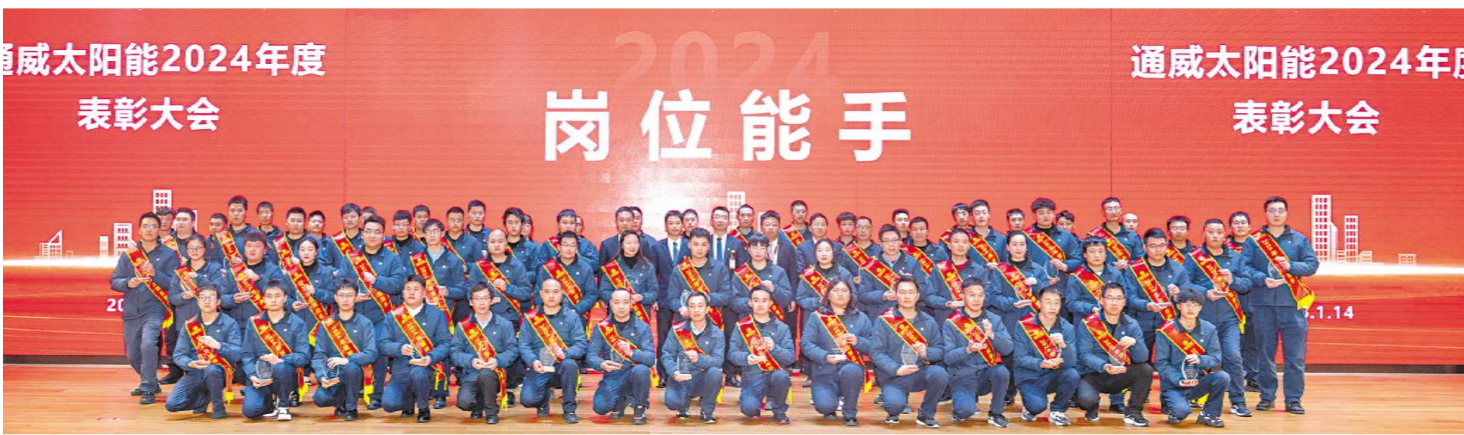
“岗位能手”颁奖现场