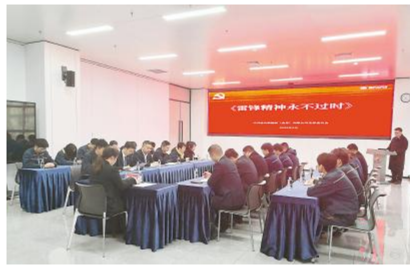
通合新能源金堂公司党支部开展“弘扬雷锋精神,践行青春使命”主题党日活动

阳春三月,通威太阳能持续开展别开生面的研学参观活动;积极组织并开展主题观影、乒乓球友谊赛等活动;加强政企联系,积极参与学雷锋志愿服务启动仪式、企业专场交友等活动,以此进一步面向大众进行光伏知识的科普;增强团队凝聚力,提升员工归属感,同时传播正能量,营造和谐健康、积极向上的工作氛围。丰富的活动展现了通威太阳能作为行业领军者的社会责任感与人文关怀,为公司的可持续发展注入了强劲动力。