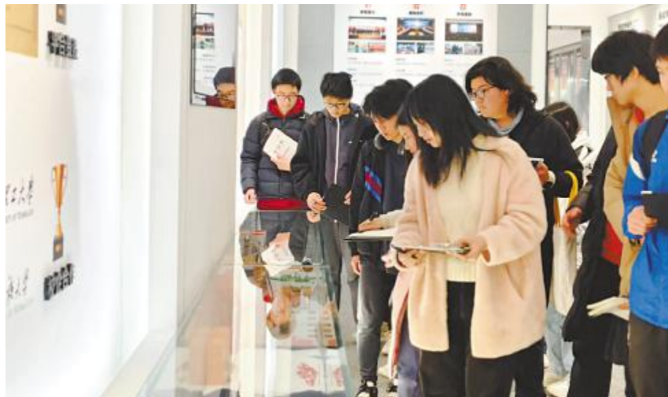
康礼学校师生一行了解产业链产品情况

交流分享现场,气氛热烈,同学们积极提问、踊跃发言,与分享嘉宾进行了深入交流和互动。他们纷纷表示,此次研学活动收获颇丰,不仅深入体验了光伏产业智能制造的魅力,也为未来的学习和职业规划提供了新的思考和启迪。