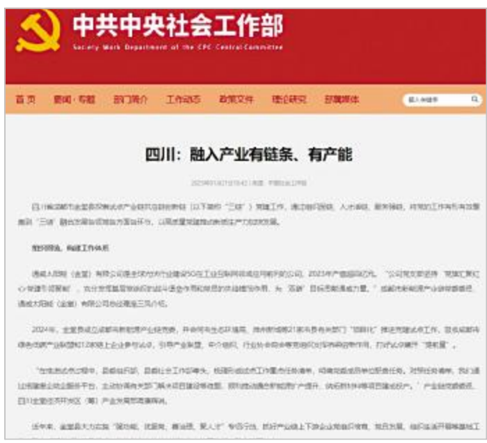
中共中央社会工作部官网聚焦报道通威太阳能(金堂)有限公司产业链供应链创新链党建工作

未来,通威太阳能(金堂)有限公司将积极配合金堂县政府持续推动新能源新材料产业的建圈强链,助力特色园区打造一体推进进程,提升新质生产力,为产业及社会经济高质量发展贡献通威智慧与力量。(通讯员 梁家麒)